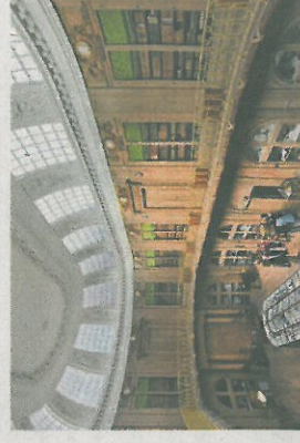
Teylers Museum, Haarlem