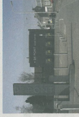
Museum De Pont

Op de foto's: culturele instellingen mede mogelijk gemaakt door een mecenas.